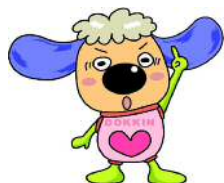
公正取引委員会キャラクター