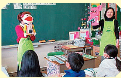
消費者教育コーディネーターによる 授業支援の様子