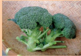
ブロッコリー（緑区）