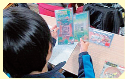
子どもたちが自身が情報を集めて、 どの商品を選ぶか考えます

子どもたちの新しい学びに対応した消費者教育の支援をしています。 ぜひ、ご利用ください。