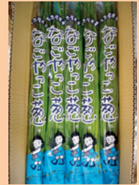
なごやっこねぎ（中川区）