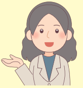
消費者教育 コーディネーター

子どもたちの新しい学びに対応した消費者教育の支援をしています。 ぜひ、ご利用ください。