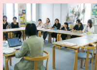
くらしのゼミナール