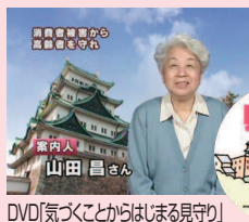
DVD「気づくことからじまる見守り」