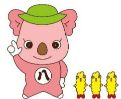
コアラのハッピー

◆電話は「消費者ホットライン188」からも最寄りの消費生活相談窓口につながります。